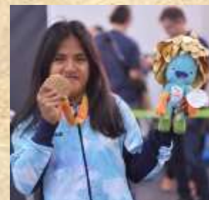
Yanina Martínez, Campeona Paralímpica de Atletismo al ganar los 100 m. llanos (T36) en Río 2016

Si se analizan los planes de estudio de los centros de formación de docentes tanto privados como estatales, nos daremos cuenta que, a pesar de los años transcurridos, adolecen del mismo defecto: se da excesiva importancia al deporte entendido como deporte de alto nivel y casi ninguna relevancia al deporte recreativo, deporte de ocio, paralímpico, adaptado ó alternativo adaptado.