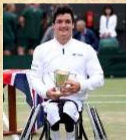
Gustavo “Gusty” Fernández, ganador del Abierto de Australia, Roland Garros y Wimbledon